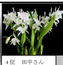
4 位 田中さん