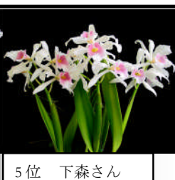
5 位 下森さん